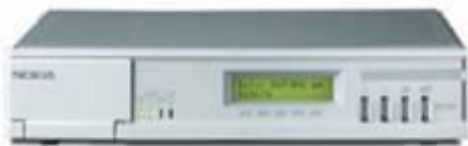
Gambar 2. Modem DNT2M

Yang dimaksud dengan Modem Back to Back adalah modem ini harus digunakan secara berpasangan, yang mana salah satunya diset sebagai master dan yang satunya diset sebagai slave . Modem DNT2M master digunakan untuk koneksi ke source perangkat Indosat, biasanya ditempatkan di ruang server (ruang radio ataupun ruang fiber optik) milik INDOSAT, sedangkan untuk Modem DNT2M yang slave digunakan untuk mengkoneksikan ke perangkat pelanggan, ditempatkan di ruang server milik pelanggan. Modem DNT2M ini mampu menghasilkan keluaran maksimal sebesar 2Mbps atau setara dengan 32 x 64Kbps.