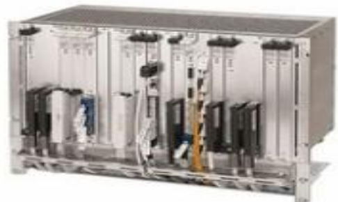
Gambar 3. Modem DNT2M

Dalam sistem jaringan baru ini yang digunakan pada receiver ialah Universal Multiplexer 1500 (UMUX 1500) yang menggantikan fungsi dari Modem DNT2M pada sistem yang lama. Sesuai yang telah diungkapkan pada sistem jaringan lama, bahwa semakin berkembangnya zaman dan teknologi maka semakin berkembang pula kebutuhan pelanggan dalam suatu jaringannya untuk melakukan komunikasi di perusahaan pelanggan tersebut. Untuk menanggulangi hal tersebut maka UMUX 1500 adalah perangkat yang ter- manage , karena UMUX adalah salah satu Multiplexer Multi Service yang di implementasikan di banyak operator telekomunikasi dunia salah satunya adalah INDOSAT.