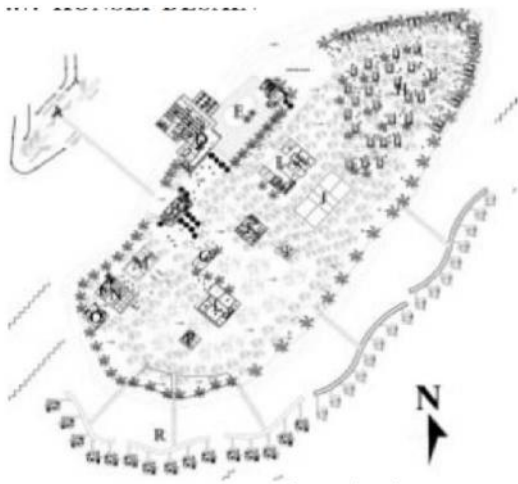
Gambar 3. Site Plan

Untuk bangunan penunjang lainnya tidak dilampirkan karena penekanan konsep bioklimatik hanya ditekankan pada bangunan utama yaitu resort/cottage, front office, restaurant, retail 2, dan fitness center, dengan aplikasi bukaan yang disesuaikan dengan kenyamanan dan konsep bioklimatik lainnya pada bangunan berupa media tanam secara vertikal dengan penggunaan pot-pot kecil yang diberi tanaman rambat (planting), penggunaan teras pada setiap bangunan sangat berpengaruh pada tingkat kenyamanan termal, karena dengan aplikasi teras yang lebih dapat meminimalisir hawa panas dari luar ke dalam bangunan, dan aplikasi skylight yang diaplikasikan pada setiap bangunan inti, dapat mengurangi penggunaan energi listrik pada siang hari, selain itu ada pula pemanfaatan energy surya pada bangunan dengan pengaplikasian solar panel yang dipasang pada cottage floating, yang diharapkan mampu mengurangi penggunaan energy listrik, sehingga